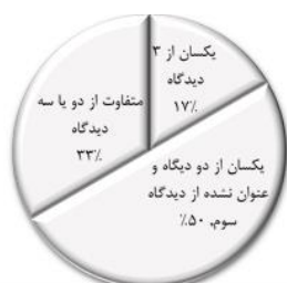
شکل ۶: بررسی عامل مستحق از منظر پیمان همسان ایران، فیدیک و خبرگان.

همچنین با توجه به مقایسه عامل استحقاق از منظر سه دیدگاه شرایط عمومی همسان ایران، فیدیک و خبرگان (نتایج ستون‌های اول بخش‌های ۱ الی ۳ جدول ۳)، در ۵ رویداد از میان ۳۰ رویداد تعیین شده عامل استحقاق از هر سه منظر یکسان بوده، برای ۱۵ رویداد در دو منظر یکسان بوده و از یک منظر عاملی معرفی نشده و برای ۱۰ رویداد نظرات متفاوتی از دو یا سه منظر مورد بررسی معرفی شده است. مقایسه نتایج فوق در شکل ۶ ارائه شده است.