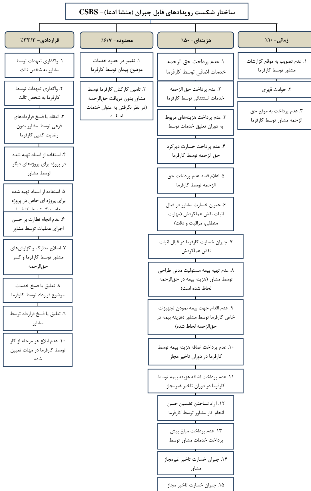
شکل ۶: طبقه بندی رویدادهای منشا ادعا بر اساس نوع.