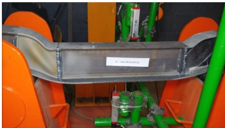
شکل ۱۲: وقوع پدیده جدا شدگی ورق CFRP در نمونه تیر B4

با بررسی نمودار نیرو-تغییر مکان (شکل ۶) مشاهده می شود که استفاده از نوارهای CFRP مورب در هر دو سمت جان بیشترین افزایش ظرفیت باربری را سبب می شود. بطور کلی مقاوم سازی برشی بوسیله الیاف CFRP باعث کاهش تنش ها و در نتیجه افزایش ظرفیت باربری و سختی جان می شود. در بین مدل های بررسی شده به صورت آزمایشگاهی، نمونه تیر مقاوم سازی شده به صورت مورب در دو طرف جان بهترین عملکرد را از خود نشان داده و ظرفیت باربری بیشتری را نسبت به نمونه های دیگر داشت.