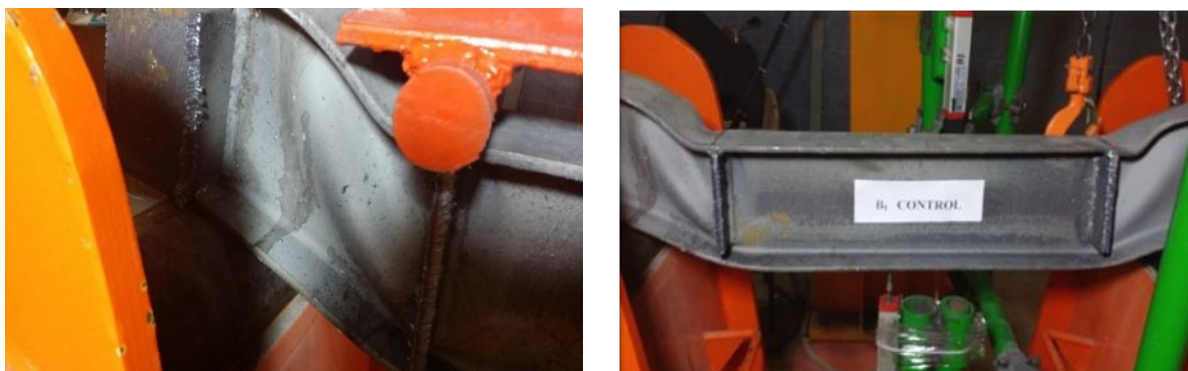
شکل ۷: کماتش قطری نمونه شاهد در ناحیه برشی