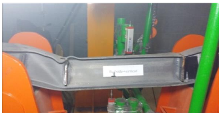
شکل ۹: ایجاد کماتش قطری در ناحیه برشی پس از جدا شدن نوارهای CFRP در تیر B2