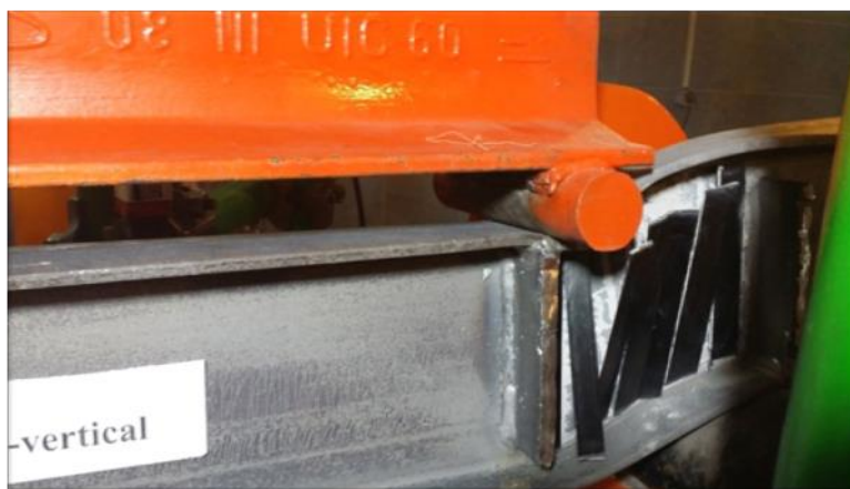
شکل ۱۱: جداسدگی (Debonding) و شکاف خوردن (Splitting) در CFRP در نمونه تیر B3