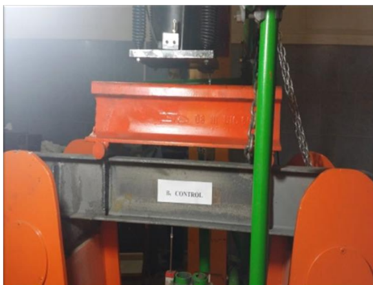
شکل ۴: آماده سازی انجام آزمایش شامل جک هیدرولیکی، تیر بارگذاری، نمونه تیر آزمایشگاهی و تکیه گاههای غلطکی

برای اندازه گیری تغییر مکانهای افقی و عمودی، از دو عدد LVDT (Linear Variable Differential Transformer) در میانه تیر استفاده شده است. LVDT یک نوع مبدل (transducer) الکترو-مکانیکی است که میتواند حرکت یا جابجایی خطی را به سیگنال الکتریکی تبدیل کند و جابجایی های بسیار کوچک از چند میلیونیم اینچ تا چند اینچ اندازه گیری نمایند.