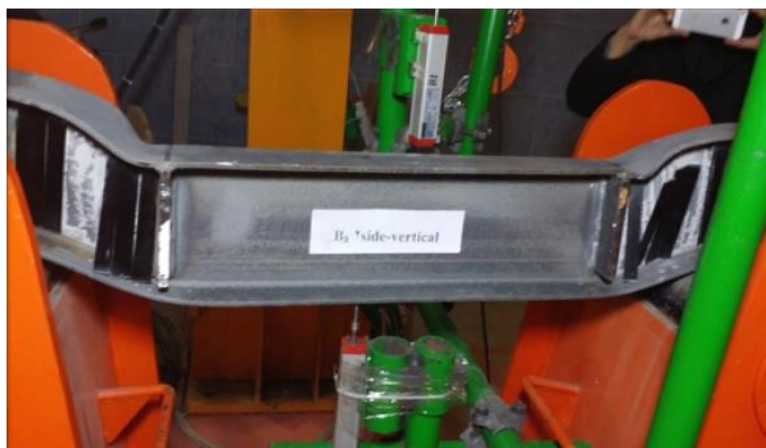
شکل ۱۰: نمونه تیر B3 بعد از بارگذاری