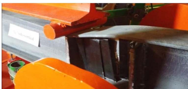
شکل ۸: جداشدگی ( Debonding ) و شکاف خوردن ( Splitting ) در CFRP در تیر B2