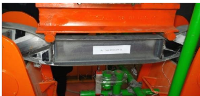
شکل ۱۳: جدا شدگی (Debonding) و شکاف خوردن (Splitting) در CFRP در نمونه تیر B5